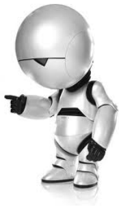
Marvin Per Anhalter Durch d. Galaxis 16x1P