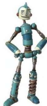
Rodney Copperbottom Robots