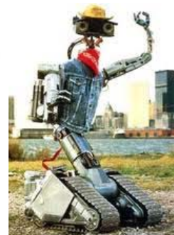
Nr.5 Nr.5 lebt