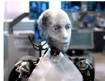
Sonny I Robot