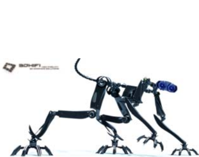
Amee Mission to Mars

50. Hier gibt es Punkte für jeden Roboternamen und den Film aus dem man ihn kennt.