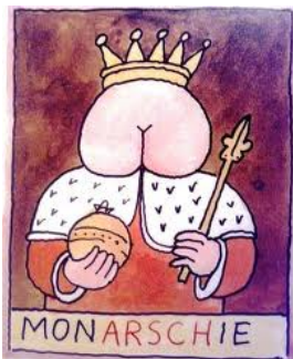
Tomi Ungerer 2P

38. Von welchem Künstler stammt dieses Bild?