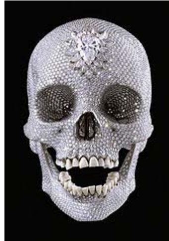
For the love of god