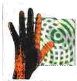
Genesis: Invisible Touch