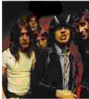
ACDC “Highway to hell”