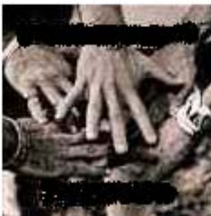
Bon Jovi Keep the Face

50. Berühmte Plattencover: Wie heißt die Band und die Platte?