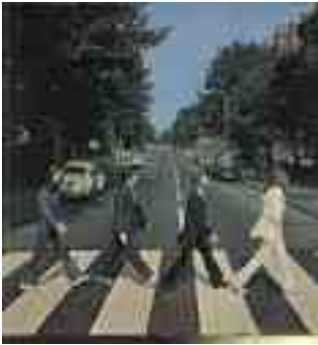
Beatles „Abby road“