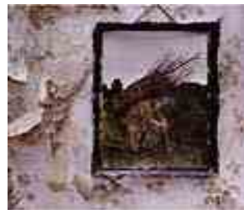
Led Zeppelin Led Zeppelin IV