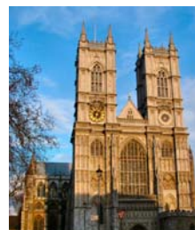
Westminster Abbey England