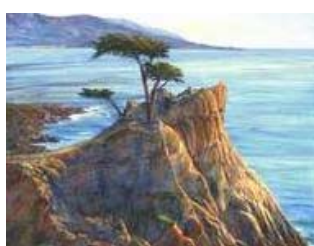
The Lone Cypress, USA