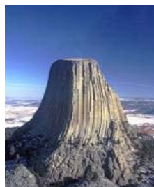
Devil's Tower USA