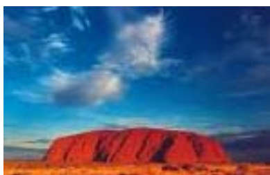
Ayers Rock, Australien