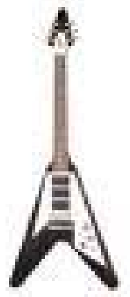
Gibson Flying V

45. Lateinamerikanische Tänze, im Tänzerjargon kurz Latein genannt, ist ein feststehender Sammelbegriff für fünf Gesellschaftstänze und Turniertänze. Nenne drei von ihnen: