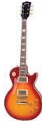
Gibson Les Paul