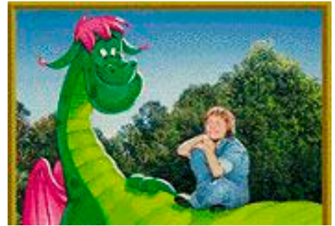
Tabaluga, Grisu, Elliot,