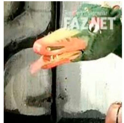
Fuchur, Urmel, Frau Mahlzahn (Bilder im Anhang).