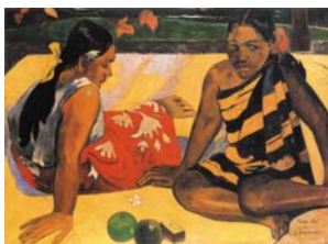
Zwei Frauen aus Tahiti / Paul Gauguin 2x2P

31. Wer kennt Titel und Maler dieses Bildes?