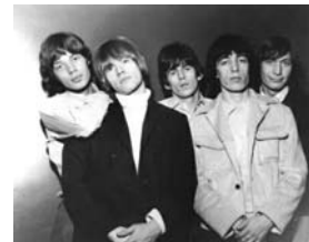
The Rolling Stones

19. Schätzfrage: Wie viele Formel-1 GrandPrix Siege gelangen Michael Schumacher und wie viele seinem Bruder Ralf?