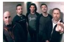
Anthrax (Je 2)