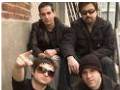
Life of Agony