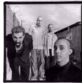
System of a Down