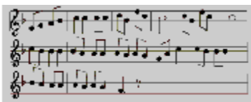
Fuchs du hast die Gans gestohlen