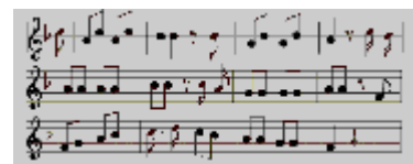
Der Kuckuck und der Esel

78. Wo findet derzeit die Leichtathletik WM statt?