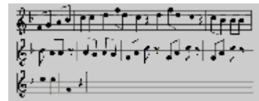
Häschen in der Grube