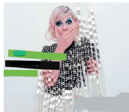
Juli: Wir beide.