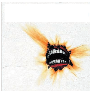
Billy Talent: II (zwei).