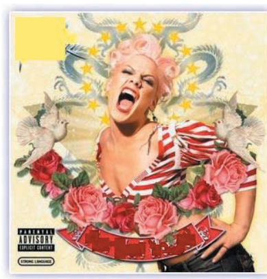
Pink: I'm not dead.