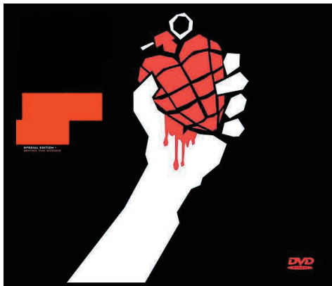
Green Day: American Idiot.