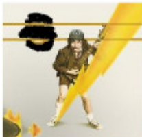
AC/DC High Voltage

51.) Und noch mal was zum punkten. Welche Alben von welchen Gruppen sind hier zu sehen (je 2 Pkt)