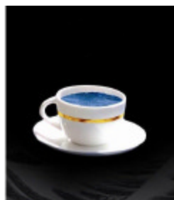
Yusuf Islam An Other Cup

Masterfrage: In welcher Religion wird das Laubhüttenfest gefeiert? Judentum