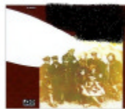
Led Zeppelin II.