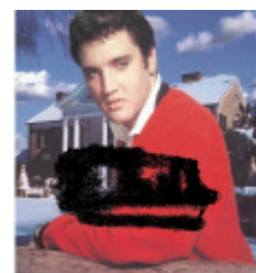
Elvis Presley White Christmas