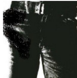
Rolling Stones Sticky Fingers