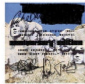
Deep Purple In Rock