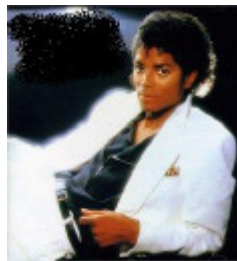
Michael Jackson Thriller