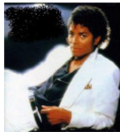
Michael Jackson Thriller