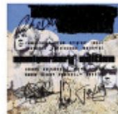
Deep Purple In Rock