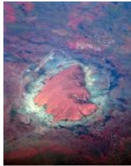
Ayers Rock 869m