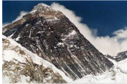
Mount Everest 8844m