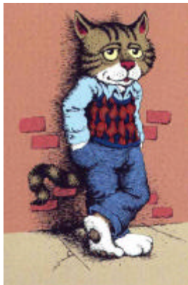
Fritz the Cat