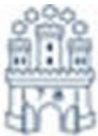
Hoffmann und Campe