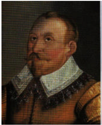
Gustaf II. Adolf

32.) Portraits des Weltgeschehens. Wer ist denn wer auf diesen Bildern? (je 2 Pkt.)