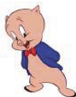
Porky Pig (Schweichen Dick),